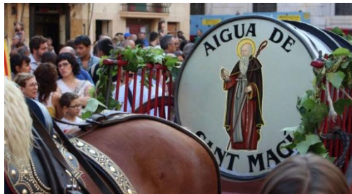
Baixada i arribada de l'aigua de Sant Magí de la Brufaganya a Tarragona