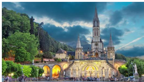
Santuari de la Mare de Déu de Lourdes