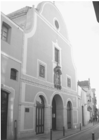
Antiga església del convent de Sant Josep, avui parròquia diocesana del mateix nom.

punt d'haver de demanar moltes vegades ajuda als responsables de l'Orde "por el continuo confesionario, auxilio a moribundos, asistencia a las religiosas y trabajos extraordinarios que no se hallan quizás en ningún otro convento de la Provincia" ( cartes de la comunitat al pare Provincial, 24-V-1820 i 9-XI-1830 ).