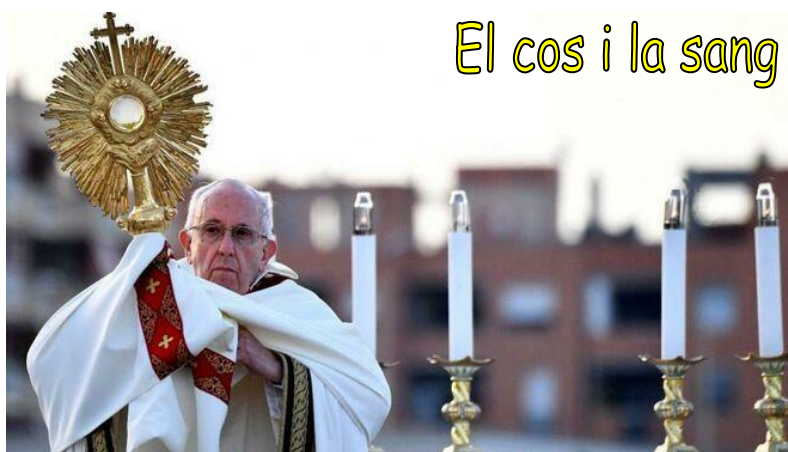
El cos i la sang de Crist